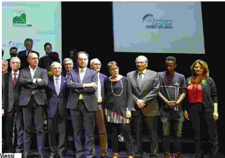
Servizio a cura di Giancarlo Ferrario, Alice Groppelli, Mattia Ferrara, Sonia Meroni, Leonardo Berta e Valeria VESSI

Ritaglio stampa ad uso esclusivo del destinatario, non riproducibile.