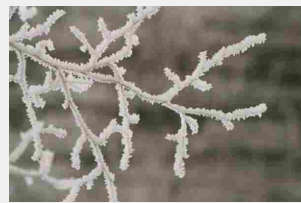
Gelate nelle ore notturne Peggioramento previsto da venerdì